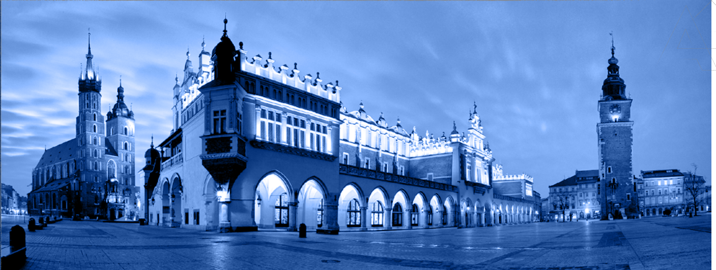
Rynek Główny, Kraków Main Market Square, Kraków