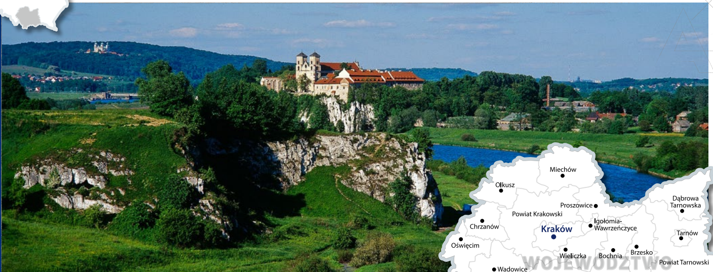
Opactwo Benedyktynów w Tyńcu The Benedictine Abbey in Tyniec